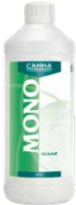
CANNA Mono Stickstoff 17 % 1 Liter