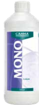
CANNA Mono Kalium 16 % 1 Liter