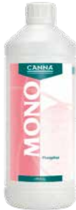
CANNA Mono Phosphor 17 % 1 Liter