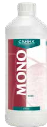
CANNA Mono Eisen 0,1 % 1 Liter