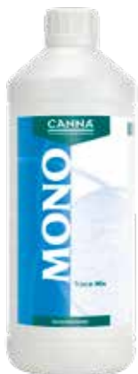
CANNA Mono Trace Mix Spurenelemente 1 Liter

Der Trace Mix versorgt die Pflanzen mit einem ausgeglichenen Verhältnis der wichtigsten Makronährstoffe (Fe, Cu, Mo, Mn, Zn, B). Somit wird ein gleichmäßiges Wachstum garantiert und Nährstoffmängel vorgebeugt.