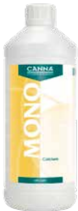
CANNA Mono Calcium 12 % 1 Liter