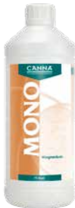
CANNA Mono Magnesium 7 % 1 Liter